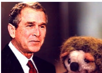
Goodbye, Mr. President... and don't let the door hit you on the way out! Wanna pretzel?

Zum Thema „Hypotheken“: Am 20. Januar, dem Tag des Auszugs von George Dabbeljuh Bush aus dem White House, habe ich übrigens auch einen kurzen Abstecher nach Washington gemacht, um ihn persönlich zu verabschieden und ihm alles Gute zu wünschen. Anschließend hatte ich eigentlich einen Termin mit Barack Obama, aber leider war er gerade auf einem Ku-Klux-Klan-Meeting und ich musste zurück nach Mexiko - ich war ja schließlich im Urlaub!