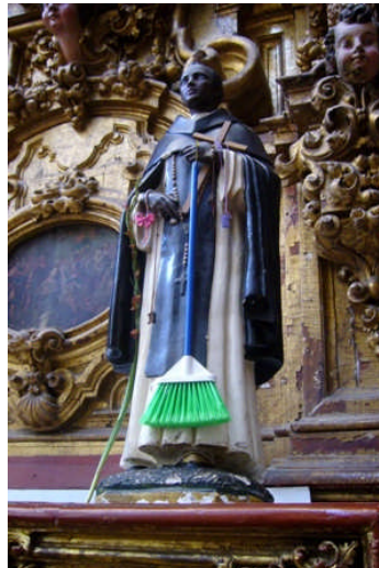
Spanischer Geistlicher in Vorbereitung auf ethnische Säuberungen (Kathedrale von Taxco)

Aber auch nur bis die Spanier kamen und die Mayas sowie die anderen mexikanischen Stämme christianisierten. Auf die Pyramiden wurden nicht selten Kirchen gesetzt, um gleich einmal deutlich zu machen, wer in der neuen Hackordnung oben steht. Mit den heidnischen Götzen wurde aufgeräumt, ganze Stämme hingemetzelt. Die Diskotheken etwa überlebten die Massaker nicht.