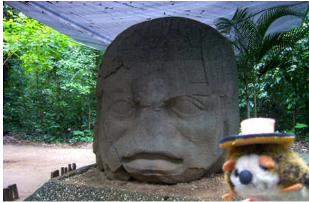
Mit Pyramiden nichts am Hut: Die Olmeken

(ay, ay, ay, ay... Willi Igel in Mexiko)