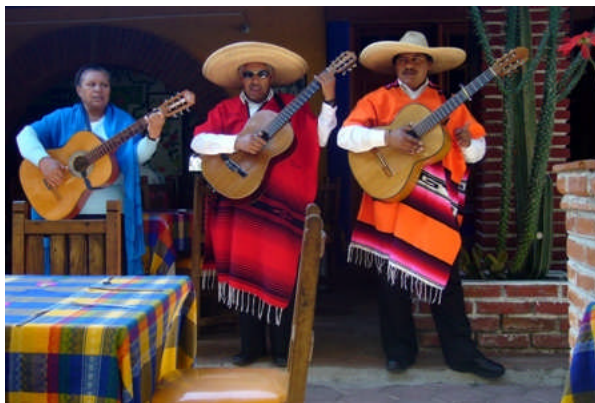
Ay, ay, ay, ay – Lärmbelästigung beim Mittagessen: Den Protagonisten steht die Begeisterung ins Gesicht geschrieben.

Deutlich schwerer zu ertragen ist dagegen die traditionelle mexikanische Mariachimusik. Dies liegt vor allem daran, dass es eigentlich nur ein einziges echtes Mariachi-Lied gibt: „Cielito Lindo“, gut zu erkennen am mit ay, ay, ay, ay, beginnenden Refrain. Damit gefühlt eine Million Mariachi-Trios in Lohn und Brot zu halten, ist ein volkswirtschaftliches Meisterstück, das gerade in Zeiten der Finanzkrise Hoffnung auf die Selbstheilungskräfte angeschlagener Branchen gibt. Allerdings auf Kosten der Touristenohren. Bereits am dritten Urlaubstag zum hundertsten Mal Cielito Lindo zu hören, gibt zwar Anlass zu ausgelassenen Jubiläumsfeierlichkeiten, zählt ansonsten aber zu den Erfahrungen, auf die man durchaus hätte verzichten können.