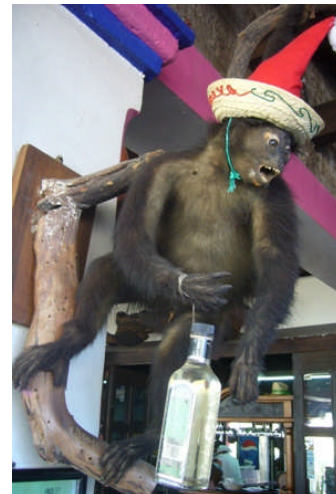
Fazit: Wer nach Mexiko reist, muss eigentlich vom wilden Affen gebissen sein!

Auf der Reiseseite „ Mexiko “ findet Ihr übrigens weitere tolle Schnappschüsse von dieser Reise.