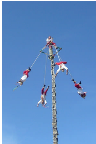
Nach Absturz in der Hypothekenkrise: Mixteken stürzen sich solidarisch vom Baum

Aber eigentlich wollte ich mich ja nach mit den Amis beschäftigen, sondern mit den mexikanischen Stämmen und den präspanischen Kulturen. Da gab es Azteken, Mixteken, Zapoteken. Nur die Hypotheken, die sind irgendwann in die USA ausgewandert, wo sie sich noch bis in unsere Zeit halten konnten, unlängst aber durch die Hypothekenkrise in Verruf geraten sind. Das hat Auswirkungen auch auf die mexikanischen Bruderstämme.