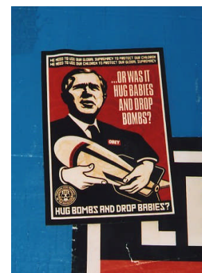
Es war nicht alles schlecht... oder?