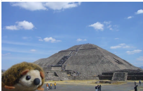
Sonnenpyramide in Teotihuacan

Und damit sind wir auch schon mitten in der mexikanischen Historie. Ich will das mal halbwegs chronologisch abarbeiten. Den Anfang machten irgendwann die schon erwähnten Azteken. Die bauten sich zu Ehren ihrer Götter ein Pyramidchen, warteten 52 Jahre und überbauten das Pyramidchen mit einer größeren Pyramide. Und nach weiteren 52 Jahren wurde wieder ausgebaut. Allerdings mit reichlich Pfusch am Bau. Während die Ägypter mühsam Stein auf Stein häufelten, haben die Azteken zwischen die Steinschichten immer wieder auch Lehm und Erde gefüllt. In der Hoffnung, dass die Götter so genau nicht hinschauen würden. So kamen dann irgendwann ganz stattliche Gebäude zusammen: