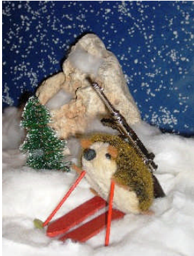
Endlich entlarvt: Die Geheimwaffe der deutschen Biathlonmannschaft!

Anlässlich der Biathlon-Weltmeisterschaften in Pjöngyang können wir das Geheimnis der unglaublichen Erfolgsserie der deutschen Biathleten bei den Weltmeisterschaften und Olympischen Spielen der letzten Jahre lüften: Von der Öffentlichkeit weitgehend unbemerkt ist die Mannschaft erheblich verstärkt worden.