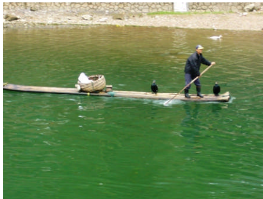
Unter Geiern: die Deutschen ruderten bei Olympia hinterher