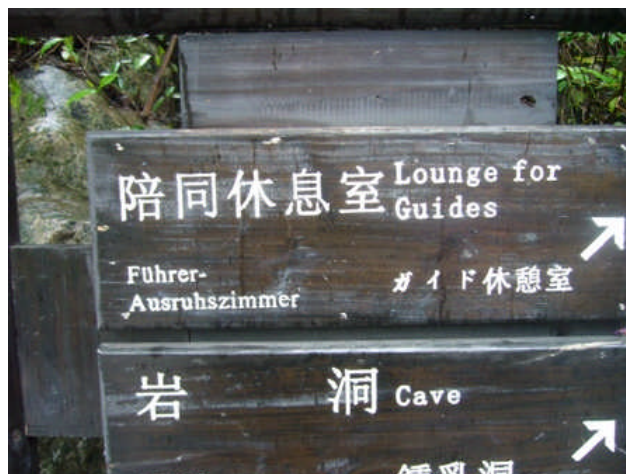
Wenn dass der Führer wüsste...

Insgesamt waren es also Spiele ganz im Geiste von 1936. Ein Propagandafest mit Negern, die im Sprint alles abräumen. Sogar an die chinesische Parteiführung, meist ja ältere Herren, war überall gedacht: