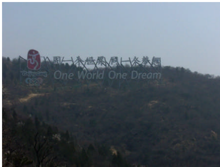
Aus der Traum....