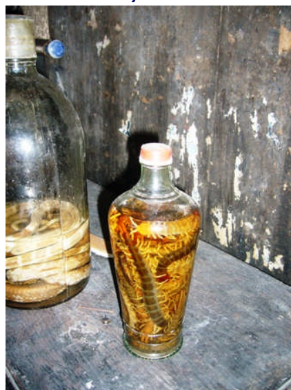
Schlangenessenz und Tausendfüßlerschnaps: Geheimnis der 51 chinesischen Goldmedaillen