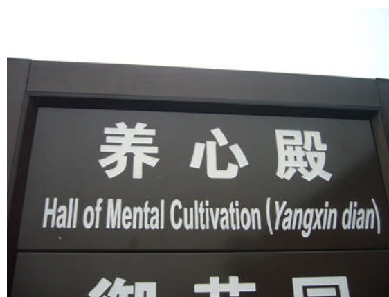
Zwangszentrale Mentalkultivation statt transzendentaler Meditation?

Und für die wenigen Kritiker, diese ewigen Nestbeschmutzer, die meinten, demonstrieren, protestieren oder reklamieren zu müssen, war im Olympischen Dorf eine spezielle Einrichtung vorhanden: