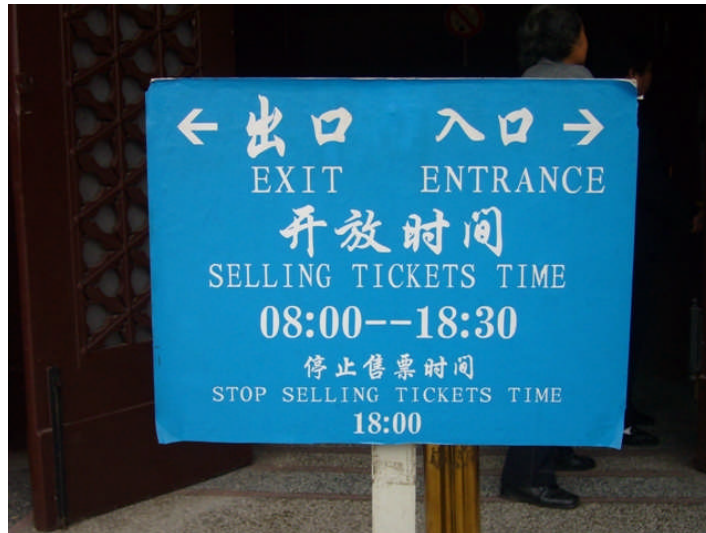
Selling Tickets Time/Stop Selling Tickets Time ???

sich in die Windeln machen mussten. Zu einem der wichtigsten Kritikpunkte ist unserem Agenten Do Ping vor Ort in Peking belastendes Bildmaterial zugespielt worden, dass schonungslos aufdeckt, warum bei vielen Veranstaltungen die Sportstätten nur zur Hälfte gefüllt waren.